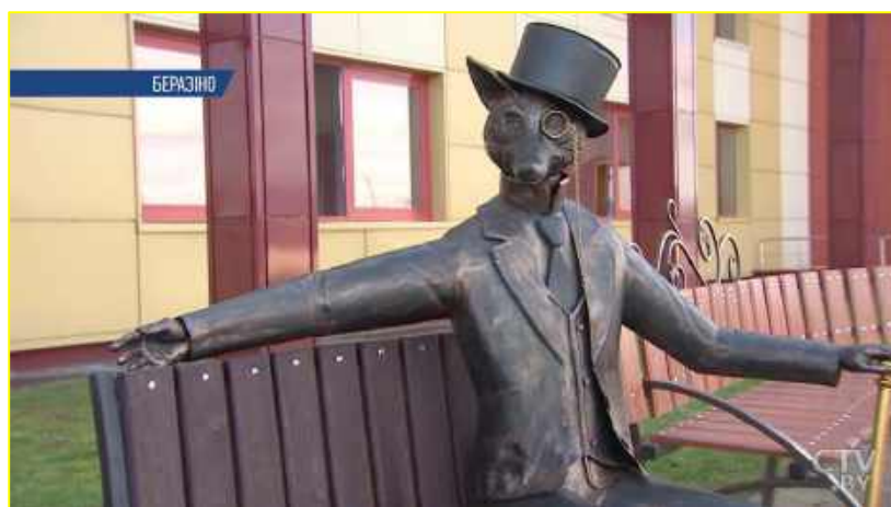
Фото 1. Лис- символ Березинского района