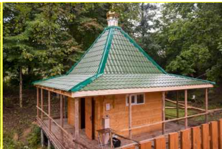
Фото 9. Купель