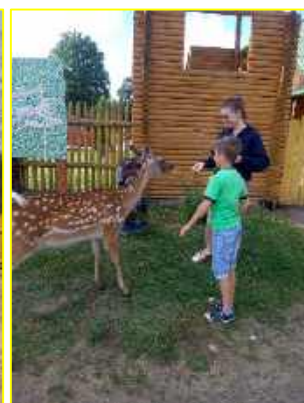
Фото 5. Вольеры с дикими животными