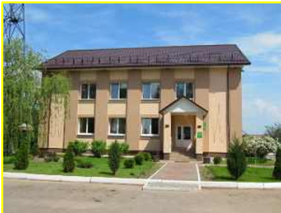
Фото 3. ГЛХУ "Березинский лесхоз"