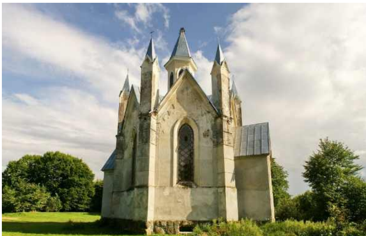
Костёл Божьего Тела

Храм в агрогородке Богушевичи внесен в список историко-культурных ценностей Республики Беларусь.