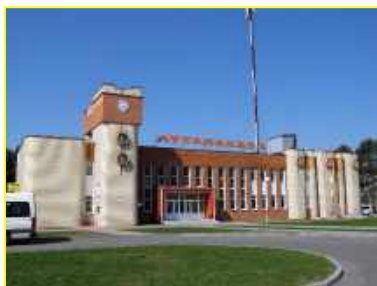
Фото 1. Автовокзал г.Березино