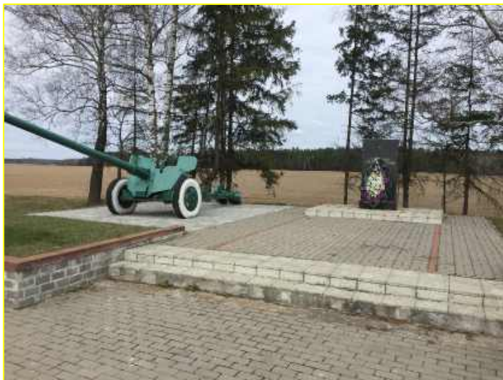
Фото 6. М4. Памятник жертвам фашизма