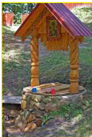
Фото 8. Источник

Часовня с купелью на семи источниках в честь святителя Николая Чудотворца