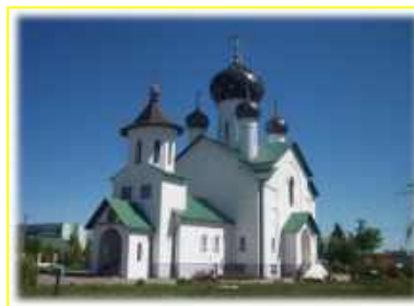
Фото 6. Свято-Никольский храм