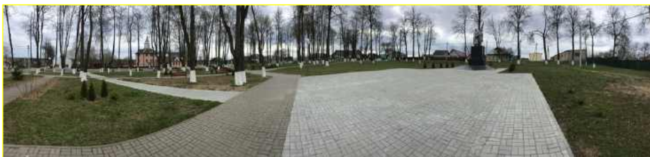
Фото 10. Панорама сквера г.Березино