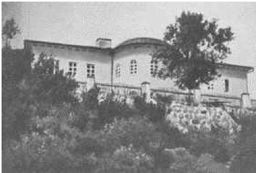
Усадебный дом графа Потоцкого

Значимым историко-архитектурным памятником Березинщины, остатки которого дошли до наших дней, является усадебный дом графа Потоцкого, построенный в первой половине XIX века из кирпича, на правом крутом берегу реки Березина, укрепленном бутовой подпорной стенкой.