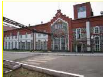
Фото 4. Березинский спиртовой завод