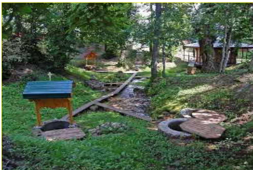
Фото 9. Общий вид источников