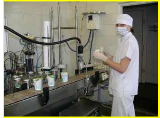
Фото 2.ООО «БИМОЛПРОМ»