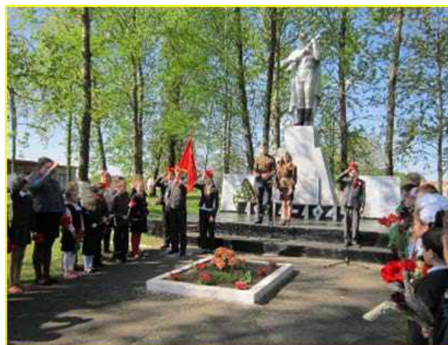
Фото 5. д.Лешница. Скульптура воина