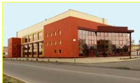
Фото 2. ГУ «Березинская ДЮСШ»