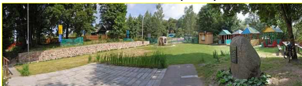
Фото 2. Внутри комплекса в д.Крупа Часовня с купелью на семи источниках в честь святителя Николая Чудотворца