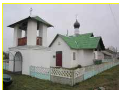
Фото 5. аг. Микуличи Храм святого Архангела Михаила