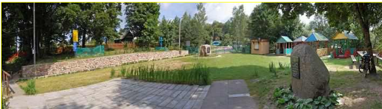
Фото 7. Комплекс в д. Крупа

Часовня с купелью на семи источниках в честь святителя Николая Чудотворца