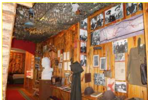
Фото 2-3. Музей «Зеркало времени»