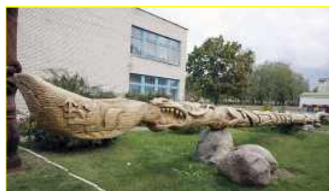
Фото 7-8. «Музей деревянной ложки» г.Березино