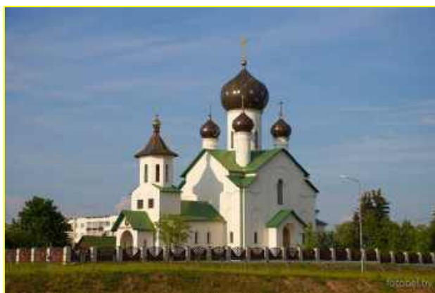
Фото 1. Свято-Никольский храм г.Березино