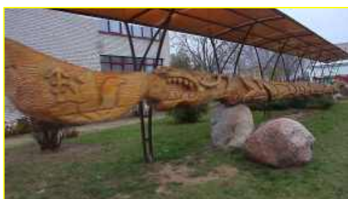
Фото 2. Памятник деревянной ложке