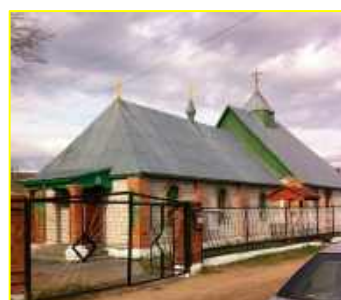
Фото 6. г.Березино Храм Преображения