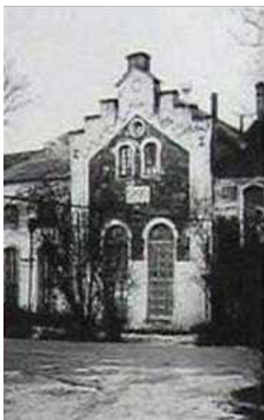
Начало XX века

Березинский спиртзавод ведет свой отсчет с 1853 года, когда в имени графа Потоцкого начал работать винокуренный завод.