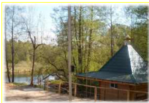
Фото 4. Купель