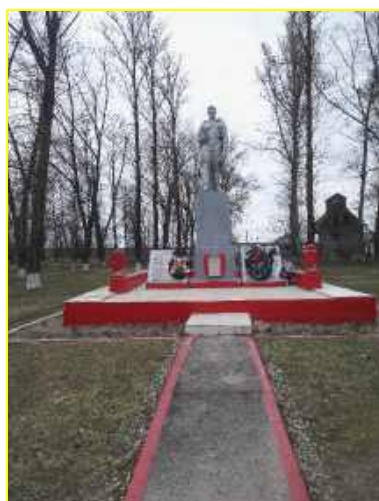
Фото 4. д.Косовка. Скульптура воина