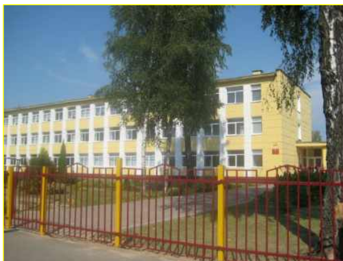
Фото 1. ГУО «Березинская гимназия»»