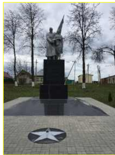
Фото 9. г.Березино. Братская могила