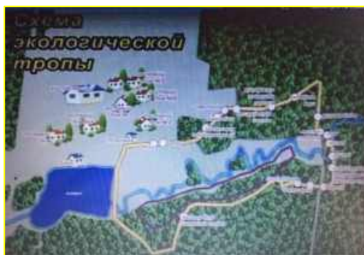
Фото 6. Схема экологической тропы