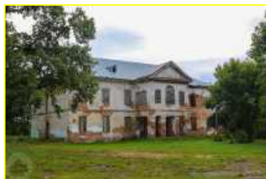
Фото 3. Усадебный дом Потоцких