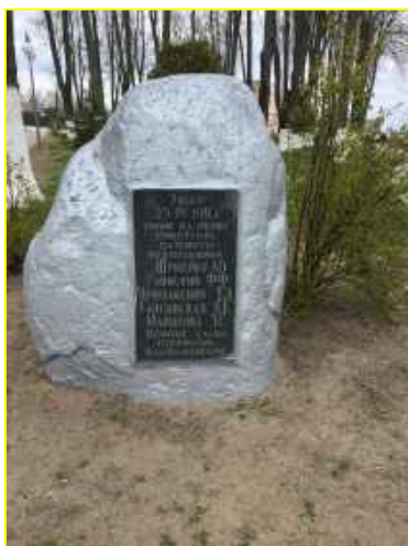
Фото 8. г.Березино. Памятный знак