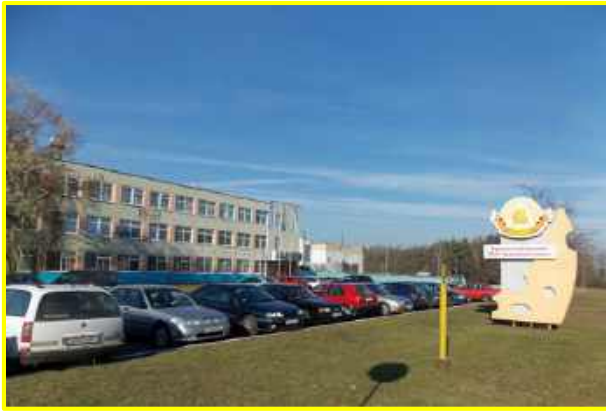
Фото 1. ОАО «Здравушка-милк»