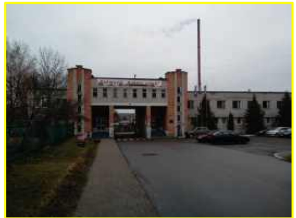
Фото 5-6. Березинский спиртовой завод