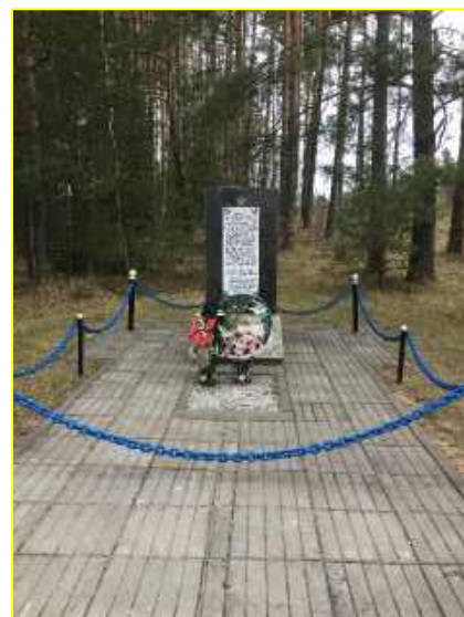
Фото 7. Памятник 3-м воинам Красной Армии