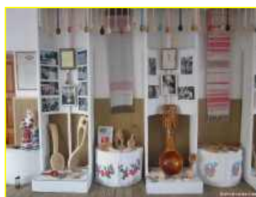
Фото 3. Музей деревянной ложки г.Березино