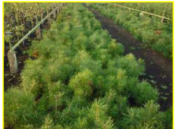
Фото 4. Питомник