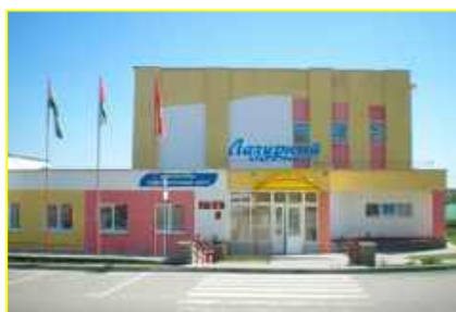
Фото 5. ФОЦ «Лазурный»