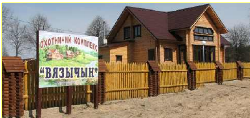
Фото 4 . Охотничий комплекс «Вязычин»