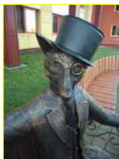
Фото 9. Лис - символ Березинского района