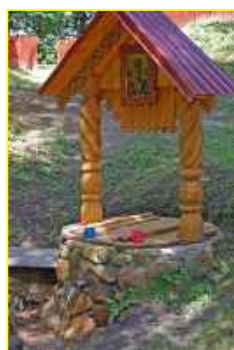
Фото 3. Источник